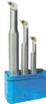
Abb.: Rechtsausführung Lieferung ohne Wendeschneidplatten.