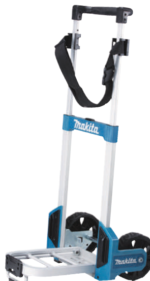
Abbildung mit Zubehör