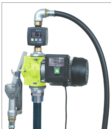
Abbildung mit elektr. Durchlaufzähler FMOG, nicht eichfähig.