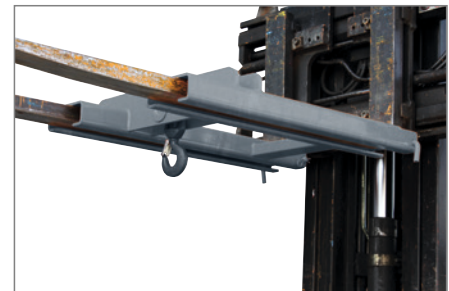
feuerverzinkt, für 2 Gabelzinken