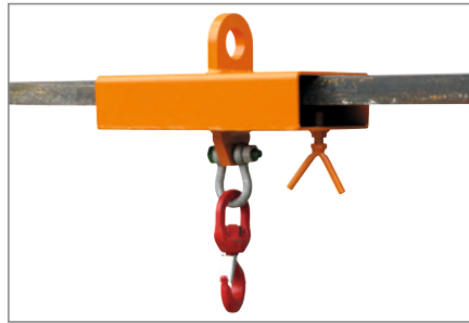
RAL 2004, für 1 Gabelzinke