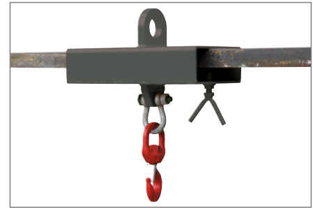
RAL 7016, für 1 Gabelzinke