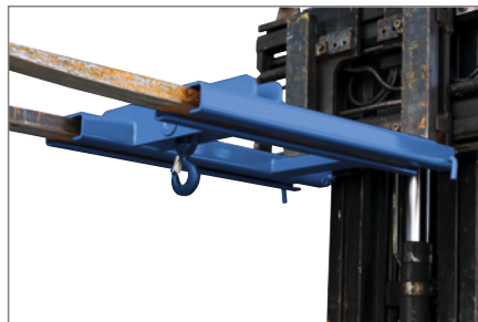
RAL 5010, für 2 Gabelzinken