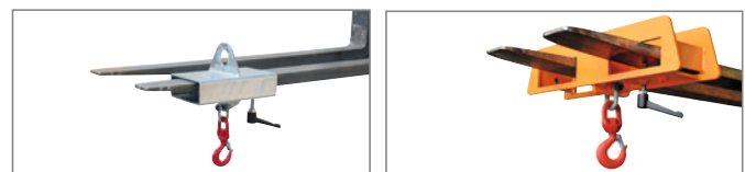
LH-I 2,0, feuerverzinkt