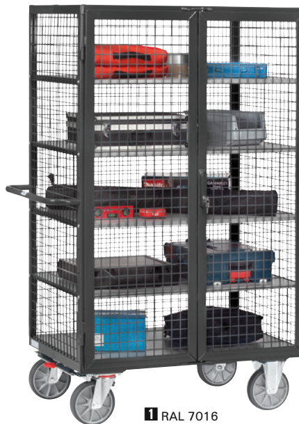
1 RAL 7016

Serienmäßig mit TOTALSTOP – Das fetra-Zentralbremssystem Mit nur einem Fußtritt werden Raddrehung und Schwenkbewegung beider Lenkrollen blockiert. Das Bremspedal bleibt immer im Sichtfeld des Bedieners.