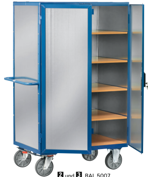
2 und 3 , RAL 5007