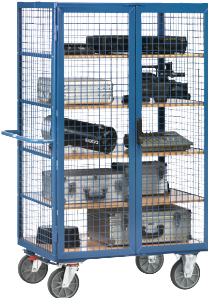
1 Treibriegel-Verschluss: Schwenkhebel, Zylinderschloss, RAL 5007