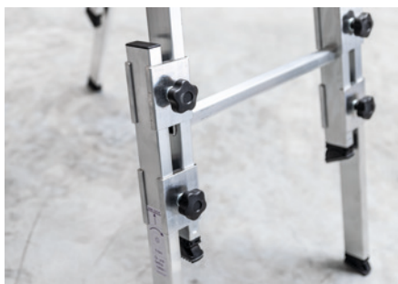
Solide und sichere Schiebeführung der Holmverlängerung.