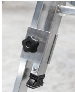
Ergonomische Softline-Sterngriffe für eine sichere Arretierung der Holmverlängerung.