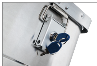
A Hebelverschlüsse inklusive Zylinderschloss (serienmäßig).