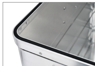
C Umlaufende Gummidichtung.