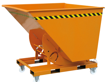
Kipper mit Rädern (optionales Zubehör).