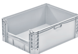
Entnahmeöffnung an der Stirnseite.