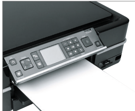
Schritt 2: Etiketten drucken und an den perforierten Stellen auf die gewünschte Größe abtrennen.