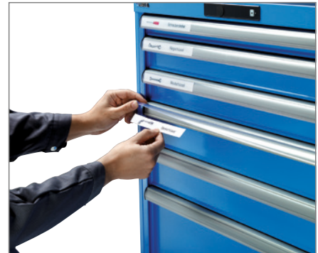
Schritt 3: Sichtfenster der Griffleiste hochklappen und Etikett einlegen. Sichtfenster durch Drücken am unteren Rand schließen. Fertig.