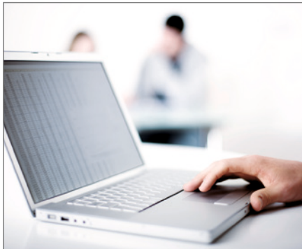
Schritt 1: Etiketten mit der Beschriftungssoftware gestalten.