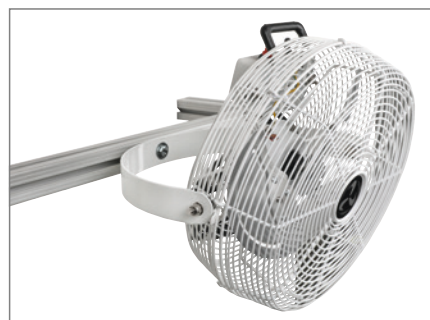
Tisch-/Überbauventilator einfache Montage an Traversen und Überbauten.