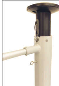
Typ HDKA-X: doppelt kugelgelagerter Drehkopf, bewährtes System.