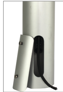
Typ HDKA-G, Alu Masttür mit 2 Sicherungsschrauben für innen liegende Seilführung bei H-DKA-G.