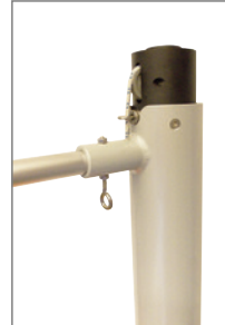
Typ HDKA-G: Gleitlager-Drehkopf, der Preisbewusste.