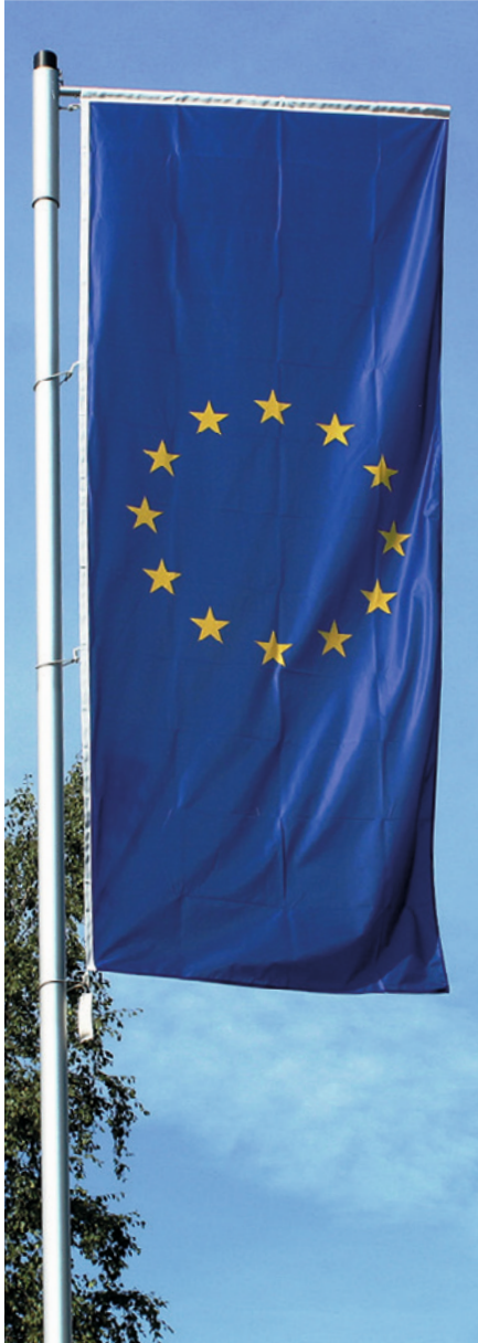
Fahnenmast Typ H-DKA-G: "Der Preisbewusste".