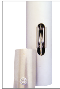
Typ HDKA-X, Masttür V2A mit Sicherheitschloss für innen liegende Seilführung.