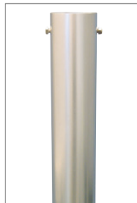
Bodenbefestigung Bodenhülse Alu für Masten ≤ 75 mm mit Durchgangsschraube. Auf Anfrage inkl. Montage mit Schraubfundament