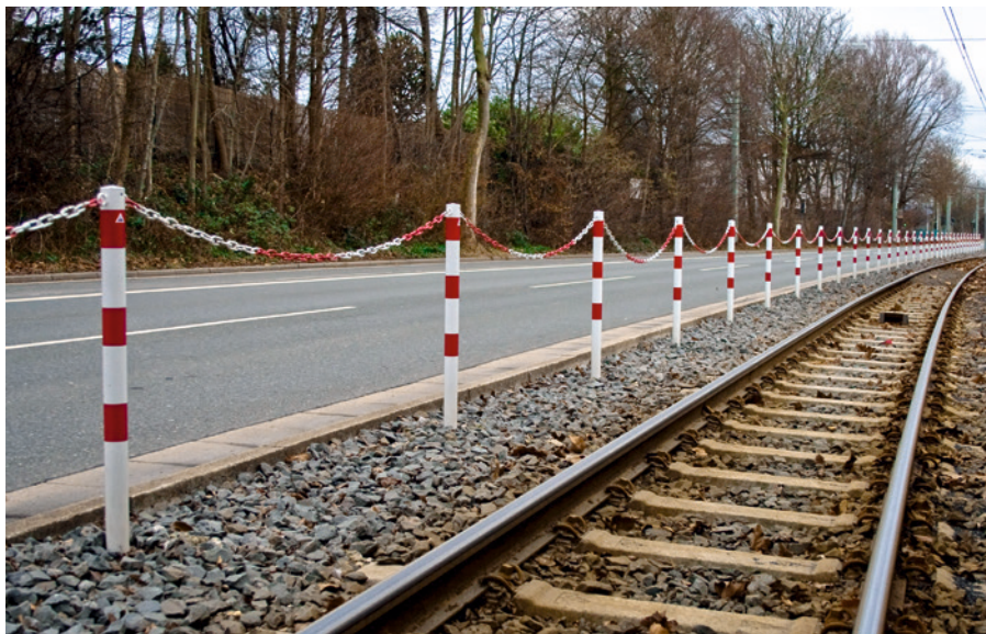
Absperrpfosten rund mit 2 Ösen.