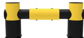
1-zeilig, Länge 1100 mm.