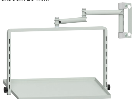
Abb. zeigt Ablagetablar am Grundrahmen mit Gelenkarm.