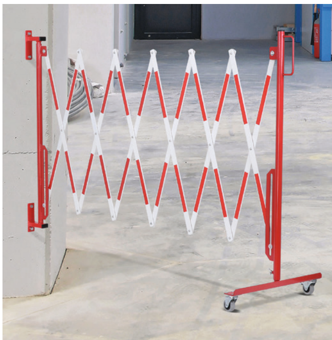
Mit Wandbefestigung und Rollenfüßen.