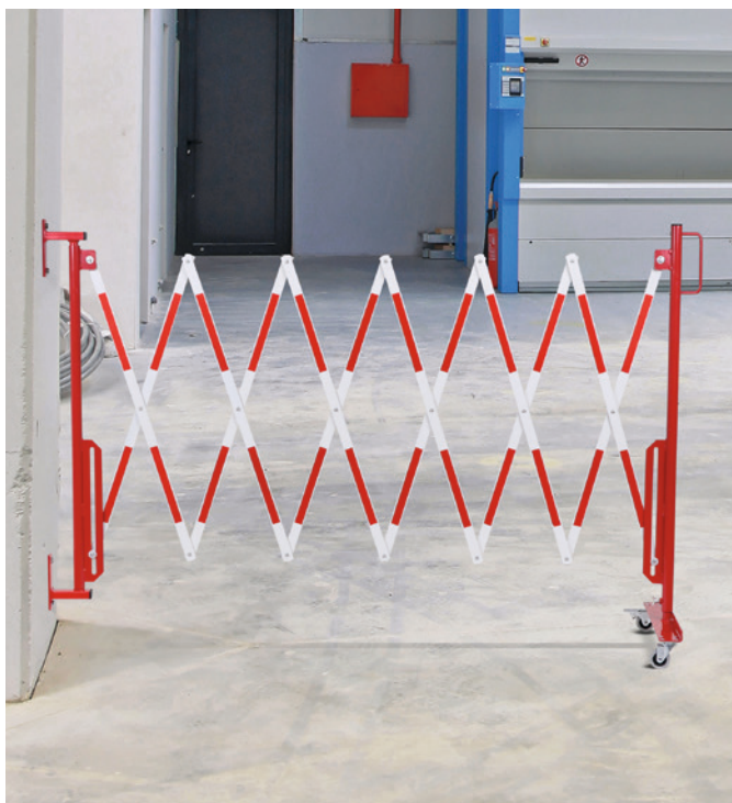
Mit Wandbefestigung und Rollenfüßen.