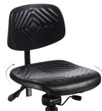
1 mybttec 360°-Sitzgelenk.