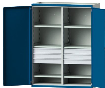
4 mit 6 Schubladen (B 650 mm, FH 120 mm) und 6 Einlegeböden.