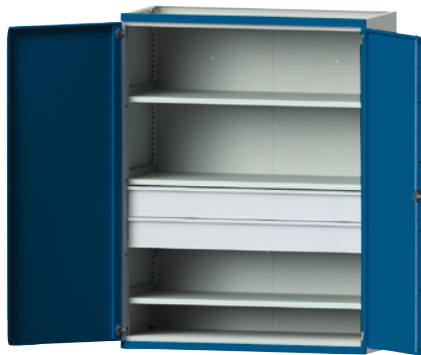
1 mit 2x XXL-Schubladen (B 1380 mm, FH 180 mm) und 3 Einlegeböden.