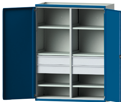
3 mit 4 Schubladen (B 650 mm, FH 180 mm) und 6 Einlegeböden.