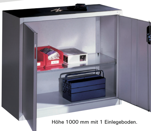
Höhe 1000 mm mit 1 Einlegeboden.