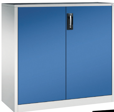
Höhe 1200 mm mit 2 Einlegeböden.