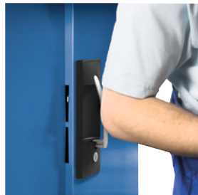
Patentierter Mechanismus: zum Schließen einfach zudrücken.