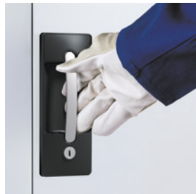
Auch mit Handschuhen einfach bedienbar! Verschleißfest und benutzerfreundlich.