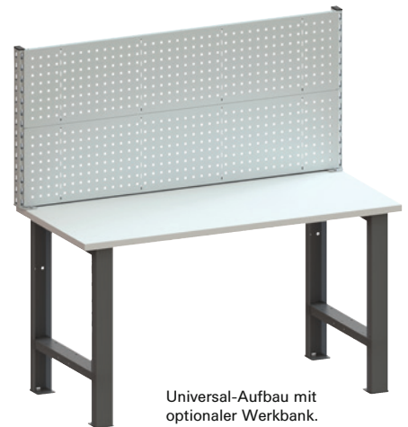
Universal-Aufbau mit optionaler Werkbank.