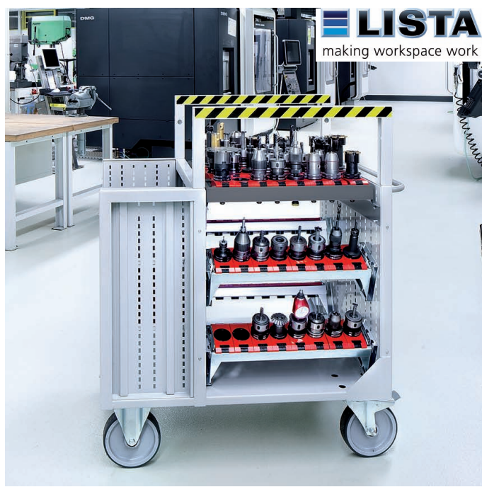
NC-Lagerung im Transportwagen.