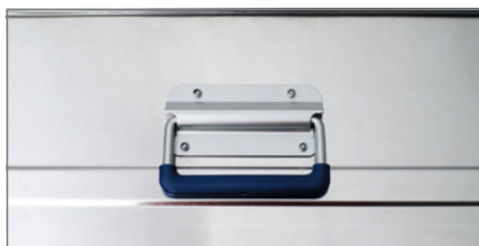
C Die selbsteinklappenden stabilen Sicherheitshandgriffe sind handsympathisch mit Kunststoff ummantelt.