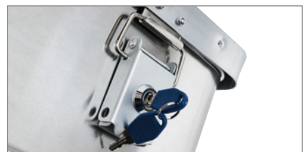
D Hebelspanverschlüsse (serienmäßig), Zylinderschloss gegen Aufpreis lieferbar.